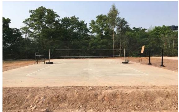
สนามตะกร้อ