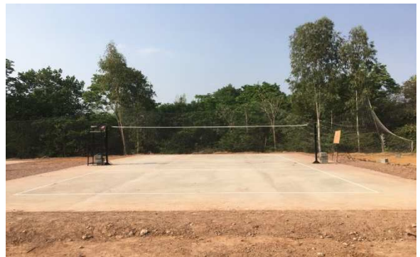
สนามวอลเลย์บอล